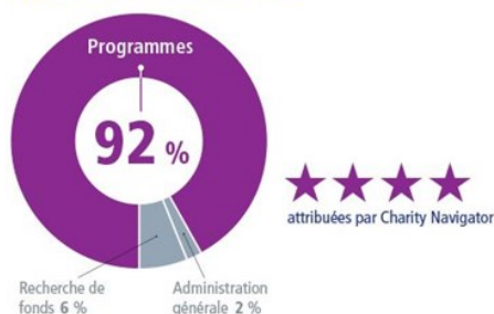
DÉPENSES DE LA FONDATION ROTARY

Cet engagement a valu à la Fondation Rotary une note de 4 **** par Charity Navigator, le plus important organisme américain d'évaluation des organisations à but non lucratif.