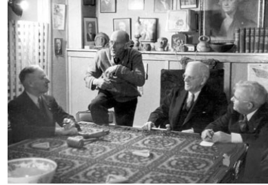
1905 - Paul Harris fonde le Rotary avec trois amis

Notre engagement solidaire ne faiblit jamais. Nous avons débuté notre lutte contre la polio en 1979 aux Philippines en décidant de vacciner 6 millions d'enfants. En 2015, seuls trois pays au monde sont encore endémiques, contre 125 en 1988.